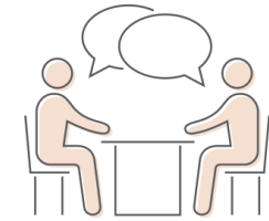
RENDICIÓN DE CUENTAS