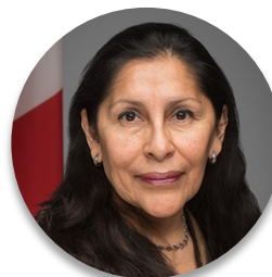
Senadora Rosa Gálvez (Canadá), Vice- Presidenta da Rede Parlamentar de Mudanças Climáticas do ParlAmericas