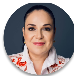
Senadora Mónica Fernández (México), Presidenta do Senado da República

No Congresso mexicano, estamos fazendo nossa parte, talvez a mais relevante atualmente, por meio de uma emenda à nossa constituição para garantir em um artigo os programas sociais que apoiam idosos, pessoas com deficiência, bolsas para estudantes de todos os níveis, e prestação de serviços de saúde. Atualmente, no Senado mexicano, estamos analisando as questões e reformas administrativas para iniciar, no dia 1º de julho, o Tratado de Livre Comércio entre o México, os Estados Unidos e o Canadá. Da mesma forma, concordamos em abrir canais de transparência e diálogo com a cidadania, e acreditamos na universalidade do acesso a um estado de bem-estar social. Devemos pressionar por esse caminho.