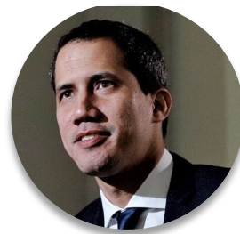
Deputado Juan Guaidó (Venezuela), Presidente da Assembleia Nacional

A democracia está sempre em jogo e é com instituições fortes que podemos enfrentar essa situação, bem como com a democracia a serviço da cidadania. Os parlamentos têm um papel fundamental de diálogo, de canalizar essa demanda social e essa necessidade de solução e articulação com os diferentes poderes, para servir nosso povo. Determinamos que o setor vulnerável na primeira linha de defesa contra o vírus na área da saúde deve ser observado. Hoje uma enfermeira ganha US$ 4,00 por mês na Venezuela, e por isso determinamos um bônus de saúde diretamente para essa linha de defesa.