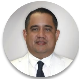
Deputado Marcos Castellero (Panamá), Presidente da Assembleia Nacional

Entre as propostas, temos a recuperação econômica sustentável e equitativa, em conformidade com os Objetivos de Desenvolvimento Sustentável da Agenda 2030, leis a favor da educação, saúde, microeconomia, pequenas e médias empresas, economia informal e reativação econômica. Também temos leis de teletrabalho, implementadas durante a quarentena para manter empregos, parcerias público-privadas, sistema nacional de medicamentos, programas educacionais e combate à pobreza multidimensional, além da criação do Sistema Único de Emergência Nacional 911.