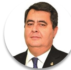
Deputado Julio Enrique Mineur , primeiro vice-presidente eleito da Câmara dos Deputados do Paraguai

Atualmente, o Congresso Paraguai continua trabalhando com um sistema misto, onde existem deputadas e deputados que trabalham em casa e outros na plenária, para não interromper nossas funções em uma situação tão adversa quanto a que temos agora e apoiar dos diferentes programas e iniciativas que exigem cobertura legal. Dentro da lei de emergência, por exemplo, procuramos fortalecer o sistema de saúde e expandir sua capacidade e rastreabilidade, e também temos feito esforços em recuperação econômica para financiar a atividade de micro, pequenas e médias empresas, para apoiar as famílias paraguaias e salvaguardar o emprego.