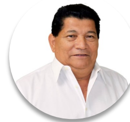
Deputado Felcito Ávila (Honduras), Quinto Vice-Presidente do Congresso Nacional

Para nós, uma das partes difíceis é o emprego, e estamos constantemente atendendo isso e gerenciando todas as instituições de previdência social para que elas respondam nesse momento. No caso do regime de contribuição privada, o Congresso aprovou reformas na lei para poder fornecer contribuições a todos(as) os (as) trabalhadores(as), mas isso não é suficiente para cobrir a demanda nacional de todos os homens e mulheres que perderam sua fonte de trabalho. Estudamos esse tópico no Congresso e, além disso, apoiamos todos os projetos do Governo para atender a esta questão.