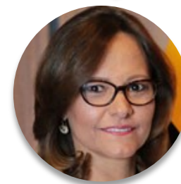
Membro da Assembleia Nacional Elizabeth Cabezas (Ecuador), Presidenta do ParlAmericas

Os parlamentos devem encontrar o caminho para que nossas propostas, além da retórica, sejam realmente significativas, e temos que assegurar sua efetividade, porque a atual situação não permite o exercício de tentativa e erro nos regulamentos e nas políticas públicas. É importante que legislemos estrategicamente com uma projeção a médio e longo prazo, para que as normas desenvolvidas para a conjuntura e suas reformas permanentes não nos levem a cenários de insegurança jurídica com duras consequências para o investimento e desenvolvimento.