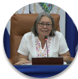
Deputada Maritza Espinales (Nicarágua), Vice-Presidente da Assembleia Nacional

No parlamento, mantivemos as atividades no mundo do trabalho, atividades socioeconômicas integradas, o ordenamento jurídico, especialmente a lei geral de saúde e a lei geral de desastres, o que nos permitiu ter uma estratégia singular, pois não declaramos medidas drásticas ou de quarentena. Temos tomado medidas graduais de acordo com o progresso da pandemia. Aprovamos um orçamento geral da República, onde, desde 2007, o investimento em saúde e educação tem sido priorizado, de modo que temos 19 hospitais habilitados, 3 especificamente para receber pacientes com COVID. O modelo de saúde da família e da comunidade permitiu-nos atender a todos os casos no país e no território.