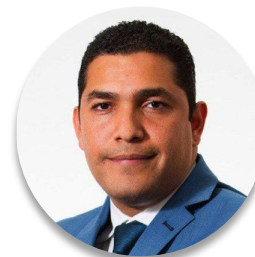
Membro da Assembleia Nacional César Solórzano (Equador), Primeiro Vice-Presidente da Assembleia Nacional

No parlamento equatoriano, passamos de reuniões físicas para reuniões virtuais, o que nos permitiu aprovar acordos comerciais que servirão para enfrentar os problemas decorrentes da emergência sanitária após a crise. Também aprovamos leis relacionadas a tributação, leis humanitárias e de alimentação escolar, e continuamos com o trabalho do parlamento, que não é apenas legislar, mas também fiscalizar. Cerca de cinco ministros compareceram virtualmente, o que nos permitiu exercer e continuar exercendo esse poder de fiscalização, um contrapeso necessário que todos os parlamentos devem ter, independentemente de estar ou não em estado de emergência.