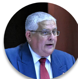
Deputado José Luis Toledo (Cuba), Presidente da Comissão de Assuntos Constitucionais e Jurídicos da Assembleia Nacional do Poder Popular

Cuba, com base em sua lei de saúde pública, desenvolveu uma estratégia com mais de 500 medidas baseadas em um sistema de saúde universal e gratuito, o que nos permitiu enfrentar e mitigar a pandemia do COVID-19 e seus efeitos. A implementação e controle dessas medidas tem ocupado os(as) deputados(as) da Assembleia Nacional. Medidas econômicas foram estabelecidas para o benefício de trabalhadores(as) e empresas, como garantias salariais para pessoas afetadas na relação de trabalho, benefícios fiscais para entidades econômicas estatais e privadas, uso de trabalho remoto devidamente remunerado. Foi ajustado o plano econômico para o ano de 2020, e estamos analisando também um possível ajuste à lei do orçamento do Estado para o ano em curso.