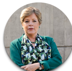
Alicia Bárcena , Secretaria Executiva, CEPAL

Os desafios causados pela pandemia podem ser classificados em dois grupos, a saber: desafios no setor de saúde, focados em ações que levam à cura, prevenção e controle da propagação do vírus, fornecimento de suprimentos críticos e gerenciamento de sistemas de saúde, onde o comportamento da população também afeta essas ações; e desafios econômicos produtivos, focados em manter ou retomar atividades econômicas, apoiar famílias e empresas, produzir insumos locais críticos, como produção de ventiladores e reconstruir cadeias de suprimentos, especialmente alimentares.