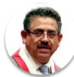
Congressista Manuel Merino de Lama (Peru), Presidente do Congresso da República

No Legislativo, tivemos que resolver como a cidadania poderia sustentar-se, independentemente dos bônus econômicos solidários, universais e familiares que o Executivo concedeu. Para fazer isso, decidimos legislar sobre as poupanças vinculadas à relação de trabalho, formadas pelos(as) cidadãos(as) por meio das Administradoras de Fundos de Pensões. A partir daí, conseguimos conceder-lhes aproximadamente US$ 1.200,00, permitindo assim resolver esses problemas econômicos. Da mesma forma, estamos exigindo ao Governo que a reativação econômica ande de mãos dadas com a capacidade de solucionar deficiências na infraestrutura e na atenção aos cidadãos.