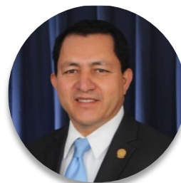
Deputado Mario Ponce (El Salvador), Presidente da Assembleia Legislativa

Como parlamento, apoiamos o Executivo em todas as medidas destinadas a lidar com a situação atual. Neste momento, nossa preocupação é ver como conseguimos construir acordos dentro do Executivo e do Legislativo para buscar e ver em que estágios e como vamos lidar com os protocolos para pessoas infectadas, bem como iniciar o processo de abertura econômica.