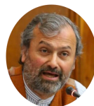
Diputado PATRICIO VALLESPÍN (Chile), vicepresidente del Grupo Bicameral de Transparencia del Congreso de Chile

“Hemos hecho esfuerzos en cada país y cada experiencia es diferente. Los planes de acción han servido, los acuerdos entre parlamentarias y parlamentarios han servido, pero ahora tenemos que abrirnos un poco más e ir mejorando con miras a esos retos que exige cada día la apertura legislativa.”