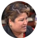
Diputada WELSY VÁSQUEZ (Honduras)

“La participación ciudadana en mi país implica la inclusión de la ciudadanía en la formulación, ejecución y evaluación de todas las políticas y acciones del Estado, convirtiéndola en protagonista y gestora de su propio destino. En 2006 se aprobó un decreto de ley para la participación ciudadana. Esta ley implica que el pueblo hondureño esté involucrado en todos los temas de leyes que aprobemos en nuestro Congreso.”