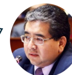
NELSON SHACK , consultant de la Banque mondiale

“Le bureau d'assistance technique budgétaire n'est pas un espace de négociation ni un centre de réflexion, mais une unité qui renforce techniquement la prise de décisions du congrès et qui permet aux pouvoirs législatif et exécutif d'avoir des discussions économiques informées.”