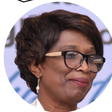
SHEILA ROSEAU, Diretora Regional Adjunta do Escritório Regional para América Latina e Caribe do Fundo das Nações Unidas para a População (UNFPA)

“A tomada de decisão em nossos parlamentos será afetada se não levarmos em conta as vastas experiências, sonhos, aspirações e ideias das mulheres que compõem a metade da nossa população. Portanto, todos nós temos interesse e um papel a desempenhar no movimento pela verdadeira igualdade de gênero em nossos países. A verdadeira igualdade de gênero se traduz em maiores benefícios para todos”.