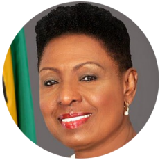
OLIVIA GRANGE, (Jamaica), Ministra da Cultura, Gênero, Entretenimento e Esportes, e anfitriã da reunião

“A igualdade de gênero é garantir que homens e mulheres desfrutem dos mesmos serviços, oportunidades, recursos e reconhecimento social. Desta forma, é com imenso prazer que dou as boas vindas às e aos delegados na Jamaica e, com grande expectativa, espero os diálogos sobre esta questão e o impacto que terão nas nossas sociedades”.