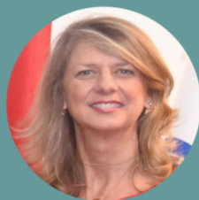
LAURIE PETERS, Alta Comissária do Canadá para a Jamaica e as Bahamas

"Este é um momento interessante para participar da formulação de políticas públicas. Agora, mais do que nunca em todo o mundo, vemos que o trabalho para a igualdade de gênero está passando do plano da conversa para o da ação, por meio de uma agenda comprometida e orientada. Como dizemos na Jamaica: "Chegou o momento!" De fato, chegou o momento. Os interessantes e exaustivos workshops por vocês realizados, são um indicador muito importante das mudanças que estão ocorrendo".