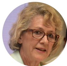
JOYCE MURRAY , Deputada e Secretária Parlamentar do Presidente do Conselho do Tesouro do Canadá

"Não é apenas a legislação que faz a diferença. Desde atitudes tomadas pelo Primeiro Ministro, até o reconhecimento de erros e do compromisso público de corrigi-los, tudo constitui ações contundentes para o avanço da matéria. Mas, a legislação tem um papel especial porque incorpora alguns desses conceitos em nossa estrutura jurídica".