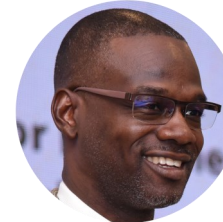
DENZIL THORPE, Secretário Permanente do Ministério da Cultura, Gênero, Entretenimento e Esportes da Jamaica