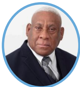
Honorable Osbert Frederick Presidente de la Cámara de Representantes, Antigua y Barbuda

Osbert Richard Frederick, ciudadano de Antigua y Barbuda, ha desarrollado una destacada trayectoria en los ámbitos de la educación, la aviación y la hotelería. Se desempeñó como docente en escuelas secundarias y en el nivel universitario en Antigua, y acumuló más de dos décadas de experiencia en los sectores aéreo y hotelero, ocupando diversos cargos de gestión. Es egresado de la Universidad de las Islas Vírgenes, donde obtuvo el título de asociado en Contabilidad y una licenciatura en Administración de Empresas con especialización en Contabilidad. Asimismo, posee una maestría en Turismo y Gestión Hotelera, con especialización en Gestión del Turismo, otorgada por la Universidad de las Indias Occidentales, campus Mona, en Jamaica.