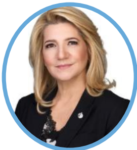
Honorable Patricia Lattanzio Diputada, Canadá

Patricia Lattanzio ha sido elegida Miembra del Parlamento por Saint-Léonard–Saint-Michel en 2019, 2021 y 2025. Es la Secretaria Parlamentaria del Ministro de Justicia y Fiscal General de Canadá, y forma parte del Comité Permanente de la Cámara de los Comunes sobre Justicia y Derechos Humanos. Asimismo, es Presidenta de la Sección Canadiense de ParlAmericas y vicepresidenta del Grupo Interparlamentario Canadá-Italia.