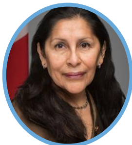
Honorable Rosa Gálvez Senadora, Canadá

La senadora Rosa Gálvez, originaria del Perú, es una de las principales expertas de Canadá en el control de la contaminación y su efecto en la salud humana. Obtuvo un doctorado en Ingeniería Ambiental por la Universidad McGill y ha sido profesora en la Universidad Laval de Quebec desde 1994, encabezando el Departamento de Ingeniería Civil y del Agua desde el año 2010 al 2016. Se especializa en descontaminación del agua y suelo, gestión de residuos y desechos, y en la evaluación de impacto y riesgo ambiental. Es miembro de la Asociación Profesional de Ingenieros de Quebec, la Sociedad Canadiense de Ingeniería Civil e Ingenieros sin Fronteras. Fue nombrada para ser miembro del Senado de Canadá el 6 de diciembre de 2016, representa a Québec (Bedford) y es senadora independiente. Su trabajo como legisladora se enfoca en fortalecer la protección ambiental, la perspectiva de género y la igualdad de ingresos, así como la transparencia en el gobierno. La senadora Gálvez fue electa presidenta de la Red Parlamentaria de Cambio Climático y Sostenibilidad durante el 5to Encuentro celebrado en junio de 2021. La senadora también ocupa el cargo de Tesorera de la Corporación de ParlAmericas.