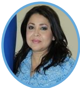
Arling Alonso Diputada, Nicaragua

La Diputada Arling Patricia Alonso Gómez es médica Master en VIH y Sida, se ha desempeñado como Coordinadora Departamental de Chinandega del Componente de Prevención y control de las Infecciones de Transmisión Sexual-VIH y Sida. Militante del Partido Frente Sandinista de Liberación Nacional. Es Diputada desde el 9 de enero de 2012, reelegida en el año 2017 y en el año 2021, por el Departamento de Chinandega, República de Nicaragua. Actualmente es Primera Vicepresidenta de la Junta Directiva de la Asamblea Nacional y en el período legislativo anterior asumió la Presidencia de la Comisión de Medio Ambiente y Recursos Naturales. Es Vicepresidenta de la Comisión de Modernización y Miembro de la Comisión de Medio Ambiente y Recursos Naturales. Se desempeña también como Presidenta del Grupo Parlamentario de Amistad con los Emiratos Árabes Unidos, Vicepresidenta del Grupo Parlamentario de Amistad con la República Popular China, Miembro del Grupo Parlamentario de Amistad con la República de Chile, la República Bolivariana de Venezuela y la República Árabe Saharaui Democrática.