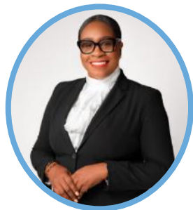
Honorable Lanein Blanchette Presidenta de la Asamblea, San Cristóbal y Nieves