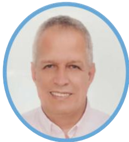
Germán Blanco Álvarez Senador, Colombia

Germán Blanco es abogado y psicólogo, especialista en administración pública, en cultura política, en derechos humanos, en derecho internacional humanitario y actualmente adelantando estudios en ciencia política. Obtuvo también un título de Magíster en Gobierno. Durante su carrera profesional se ha desempeñado como docente universitario, Gerente de Seguro Social de Antioquia, Director Edatel Antioquia; y es Teniente Coronel de la Reserva del Ejército Colombiano. Su carrera política se ha destacado por promover los asuntos sociales, la lucha provida, la economía solidaria, el medio ambiente y las actividades deportivas. Fue Diputado de Antioquia entre el año 2001 y 2007, y Presidente de la Asamblea Departamental de Antioquia en 2006. Fue Representante de la Cámara desde el 2010 hasta el 2022, donde se desempeñó como Primer Vicepresidente para el periodo 2014-2015, presidió la Mesa Directiva para el periodo 2020-2021, y formó parte de las Comisiones de Asuntos Económicos y Asuntos Internacionales. Asimismo, se destaca por ser Copresidente Fundador del Caucus Conservacionista y de los Océanos del Congreso Colombiano, y como delegado del Parlamento Colombiano en ParlAmericas. Fue electo como senador de la República para el periodo 2022-2026, ha presidido la Comisión Primera o de Asuntos Constitucionales y es parte también de la Comisión de Paz.