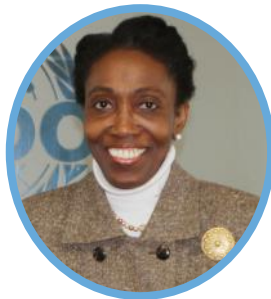
Honorable Dra. Dessima Williams Presidenta del Senado, Granada

La Dra. Dessima D Williams es una parlamentaria, diplomática y académica granadina. Ha sido embajadora de Granada ante las Naciones Unidas y la Organización de los Estados Americanos. También fue presidenta de la Alianza de Pequeños Estados Insulares en Desarrollo, donde dirigió con éxito un esfuerzo mundial de 40 islas contra el cambio climático que estableció la ambiciosa meta de mantener la temperatura media mundial en 1,5 grados. La Dra. Williams es fundadora y directora del Programa de Educación y Desarrollo de Granada (GREDED), así como cofundadora de HAITIwomen, un grupo de defensa de los derechos humanos del pueblo haitiano. Posee un doctorado y un máster en Relaciones Internacionales de la American University y fue profesora de sociología, desarrollo y género en la Universidad Brandeis de Waltham, Massachusetts. La Dra. Williams fue elegida presidenta del Senado de Granada el 31 de agosto de 2022, cargo