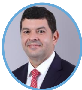
Honorable Joan Manuel Guevara Rodríguez Diputado, Panamá

Joan Manuel Guevara Rodríguez es diputado de la Asamblea Nacional de Panamá por el circuito 8-1, cargo que ocupa para el periodo 2024-2029. Su labor legislativa se centra en temas clave como la mejora de la educación y la salud, con un énfasis particular en las áreas rurales y las comunidades más desatendidas, así como en la seguridad del país. Durante su gestión, ha demostrado un firme compromiso con el fortalecimiento de la diplomacia de Panamá y el desarrollo local de su circuito.