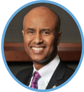
Honorable Ahmed Hussien Diputado, Canadá

El honorable Ahmed Hussien es diputado por York South-Weston-Etobicoke. Líder comunitario y abogado, representa a sus electores desde 2015.