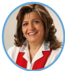
Blanca Ovelar Senadora, Paraguay

La senadora Ovelar fue electa presidenta de ParlAmericas durante la 17ª Asamblea Plenaria de ParlAmericas, acogida virtualmente por la Asamblea Legislativa de Costa Rica y reelecta para el cargo durante la 19ª Asamblea Plenaria de ParlAmericas realizada en el Congreso de la República de Colombia.