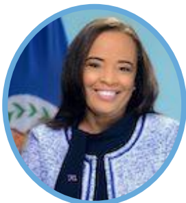
Honorable Carolyn Trench-Sandiford Presidenta del Senado, Belice

Carolyn Trench-Sandiford es una destacada defensora, en medios de comunicación, conferencias y foros, de marcos de gobernanza y planeación saludables y reformados, diseñados para reducir las desigualdades de género y espaciales, eliminar la disparidad económica y social, y mejorar la calidad de vida de las poblaciones vulnerables y las comunidades marginadas. La Sra. Trench-Sandiford aboga por los Objetivos de Desarrollo Sostenible y se asocia con organizaciones del sector público y privado y de la sociedad civil, con la academia y con grupos comunitarios para cumplir con el ODS 11 para lograr comunidades seguras, inclusivas, resilientes y sostenibles. La Sra. Trench-Sandiford está especializada en los campos de la planificación y el derecho ambiental. Carolyn es presidenta de la Asociación de Planificación de Belice y de la Asociación de Planificadores del Caribe, y es vicepresidenta de la Asociación de Planificadores de la Commonwealth. Es miembro de la Red de Líderes del Caribe 2030, un grupo regional de reflexión y acción con el mandato de mejorar la trayectoria sociopolítica y económica del Caribe, y ha sido miembro del Comité del Subsector de Planificación Física y Ambiental de la Agencia de Gestión del Riesgo de Desastres del Caribe y de las Comisiones Asesoras de la Red del Caribe para la Gestión del Suelo Urbano y del Programa de Planificación Urbana de la Universidad Tecnológica de Jamaica. También está reconocida como experta en evaluación global de la ONU.