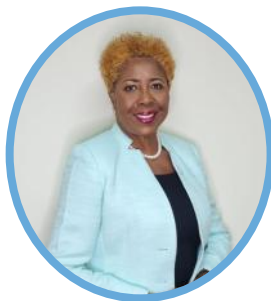
Honorable Alvina Bertram Reynolds Presidenta del Senado, Santa Lucía

La Honorable Alvina Bertram Reynolds es senadora desde el año 2021 y ocupa el cargo de presidenta del Senado desde el año 2022. Es la quinta mujer en asumir este cargo en Santa Lucía. Entre 2011 y 2016 fue ministra de Salud, Bienestar, Servicios Humanos y Relaciones de Género del 2011 al 2016 y miembro del Parlamento durante el mismo período.