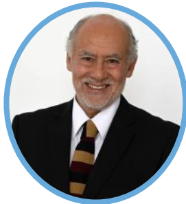
Iván Flores García Senador, Chile

Iván Flores García es senador de la República de Chile por la 12ª Circunscripción, región de Los Ríos (2022-2030). Preside la Comisión de Salud del Senado, tras haber dirigido las comisiones de Seguridad Pública y de Agricultura. Entre 2019 y 2020 presidió la Cámara de Diputadas y Diputados, donde ejerció durante dos períodos legislativos (2014-2022).