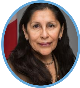
Honorable Rosa Gálvez Senadora, Canadá

La senadora Rosa Gálvez, originaria del Perú, es una de las principales expertas de Canadá en el control de la contaminación y su efecto en la salud humana. Obtuvo un doctorado en Ingeniería Ambiental por la Universidad McGill y ha sido profesora en la Universidad Laval de Quebec desde 1994, encabezando el Departamento de Ingeniería Civil y del Agua desde el año 2010 al 2016. Se especializa en descontaminación del agua y suelo, gestión de residuos y desechos, y en la evaluación de impacto y riesgo ambiental. Es miembro de la Asociación Profesional de Ingenieros de Quebec, la Sociedad Canadiense de Ingeniería Civil e Ingenieros sin Fronteras. Fue nombrada para ser miembro del Senado de Canadá el 6 de diciembre de 2016, representa a Québec (Bedford) y es senadora independiente. Su trabajo como legisladora se enfoca en fortalecer la protección ambiental, la perspectiva de género y la igualdad de ingresos, así como la transparencia en el gobierno. La senadora Gálvez fue electa presidenta de la Red Parlamentaria de Cambio Climático y Sostenibilidad durante el 5to Encuentro celebrado en junio de 2021. La senadora también ocupa el cargo de Tesorera de la Corporación de ParlAmericas.