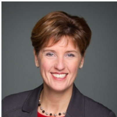
Marie-Claude Bibeau Ministra de Desarrollo Internacional y de la Francofonía

"Tenemos que asegurarnos de que las mujeres y las niñas estén empoderadas para desarrollar todo su potencial para que puedan ganarse la vida por sí mismas, lo que beneficiará tanto a las familias como al crecimiento económico de sus comunidades y países".